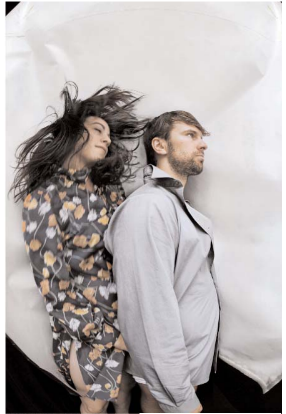
Les Steppes

From 2000 to 2010, Pierre Lecours also created a dozen works, which were presented in Montreal and elsewhere in Québec. He has also created for LADMMI, the École de danse de Québec and La Bande interdite.