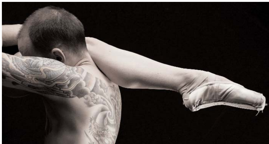
Suites Cruelles