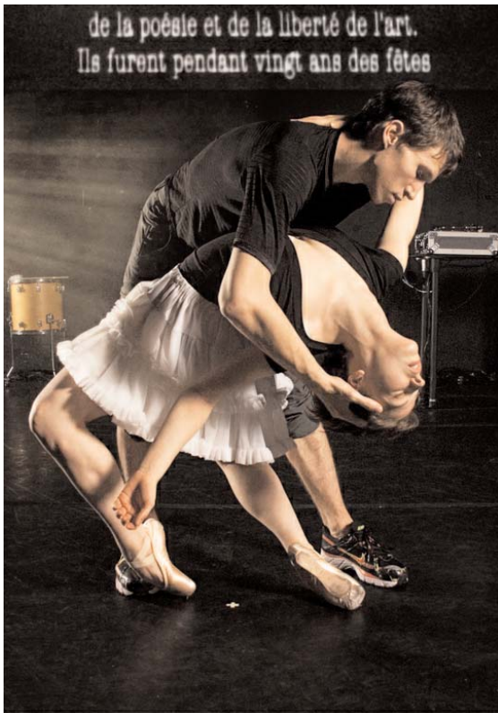
Variations S