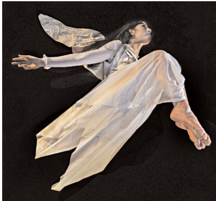
Le cabaret dansé des vilains petits canards

The Ugly Duckling's Dancing Cabaret , a work for five dancers accompanied by a pianist and intended for young children 4 years of age and over, draws its inspiration from the fairy-tale world. In these very short numbers, which follow one another, reality and imagination intersect in a sunny mix of song, music, dance, theatre and video.