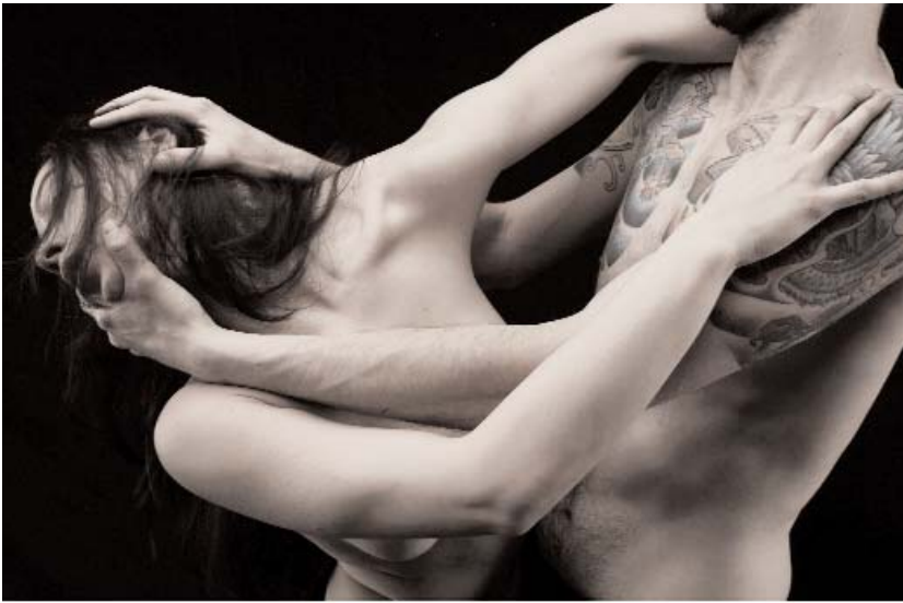
Suites Cruelles

Incandescence. Les êtres se cherchent avec fougue et dans la vacuité des regards miroite la douleur des corps. Les danseurs s'explorent, se fouillent par soubresauts et secousses athlétiques. On se viole, on se provoque, on se caresse. Course folle qui tend vers la conquête débridée du plaisir à travers l'autre. Le corps s'affole, s'interroge, s'enflamme et divague à la recherche de l'inaccessible, l'impossible rencontre des corps et des âmes. La douleur choisie scande la douleur subie. La musique lancinante et la violence du silence interrogent. Le rythme effréné obsède et envoûte. Les danseurs soutiennent la virtuosité jusqu'au paroxysme maîtrisant avec brio l'énergie brute qu'ils dégagent. Le détail léger côtoie l'intensité du désir comme des fragments absurdes d'une réalité sans complaisance. La volupté du talon haut émeut, le corps chavire puis exulte en saccades désarticulées.