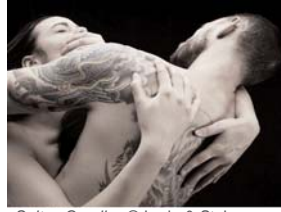
Suites Cruelles