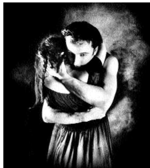
La compagnie de danse québécoise Cas Public se produit pour sept représentations.

Les danseurs, narrateurs du conte, commencent à improviser une histoire invraisemblable sur une princesse blonde qui porte des chaussures de verre, vit dans un château de pain d'épice, mange une fenêtrée en chocolat et ...tombe dans le coma. Après mille ans de sommeil " pour se réveiller, elle embrasse les trois petits cochons. " Les comédiens répètent certaines phrases les uns après les autres et se chamaillent, désamorçant à l'avance l'horreur de l'œuvre originale. Un parterre de plumes écarlates évoque le sang des victimes mais, quand les artistes s'en saisissent et les lancent dans la lumière, toute gravité s'envole avec elles. Lorsque la troupe enchaîne avec une deuxième version du conte - celle d'Anatole France - une nouvelle piste de réflexion s'offre aux jeunes spectateurs. " Nous avons tous en nous un ange comme Jeanne et un Barbe Bleue, souligne Hélène Blackburn avec malice. Nous sommes gentils, et parfois moins. Il faut apprendre à vivre avec ça le plus tôt possible! " La chorégraphe compose avec la société et avec son temps. Les américains boudent barbe Bleue? Elle le joue ailleurs. Et les enfants de France, selon elle, sont éduqués dans un esprit précieux d'ouverture. " Dans ce pays où beaucoup de nationalités cohabitent, l'idée de développer une culture forte est une vraie méthode d'intégration."